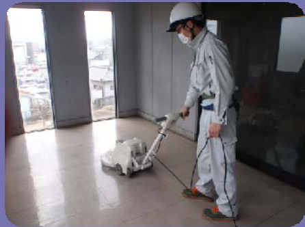
フロアメンテナンス